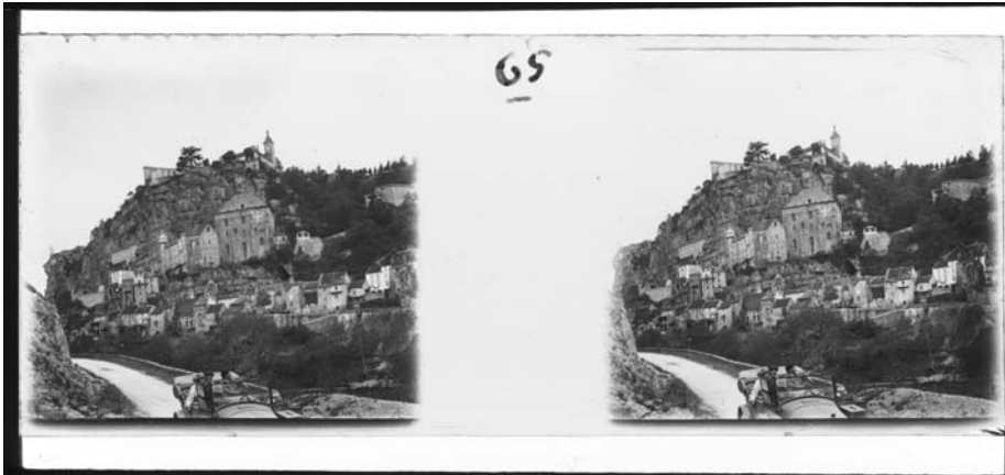
Rocamadour, französische Pyräneen, 1923.

wurden die meisten Bildinhalte bestimmt und in eine Bilddatenbank eingegeben. Somit konnten diese Trouvaillen gerettet und sowohl der Öffentlichkeit als auch der Forschung zugänglich gemacht werden. Die vorhandenen Diapositive Hahnlosers sind nach Fahrten geordnet und durchnummeriert; zahlreiche sind eigenhändig bezeichnet.