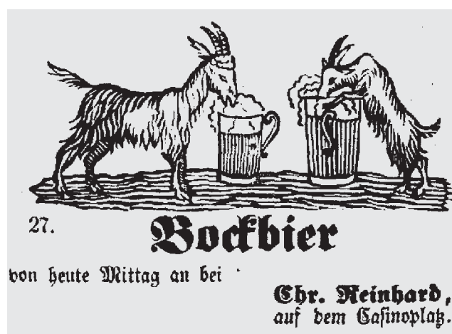
Diese Werbung für Bockbier im «Intelligenzblatt für die Stadt Bern» vom 1. Mai 1858 ist ein frühes Beispiel für grafische Elemente in den Inseraten dieser Stadtberner Zeitung.

Der Titel «Intelligenzblatt» verleitet heute zur Vorstellung, dass sich diese Zeitung nur an gescheite Leute richtete. Dies war jedoch nicht der Fall; der Name war im 18. und 19. Jahrhundert ein Synonym für Nachrichtenblatt. Diese Wortbedeutung findet sich heute noch im englischen Wort Intelligence , das unter anderem Nachricht bedeutet. In der Schweiz existierten im 19. Jahrhundert rund zwanzig Zeitungen mit diesem Titel.