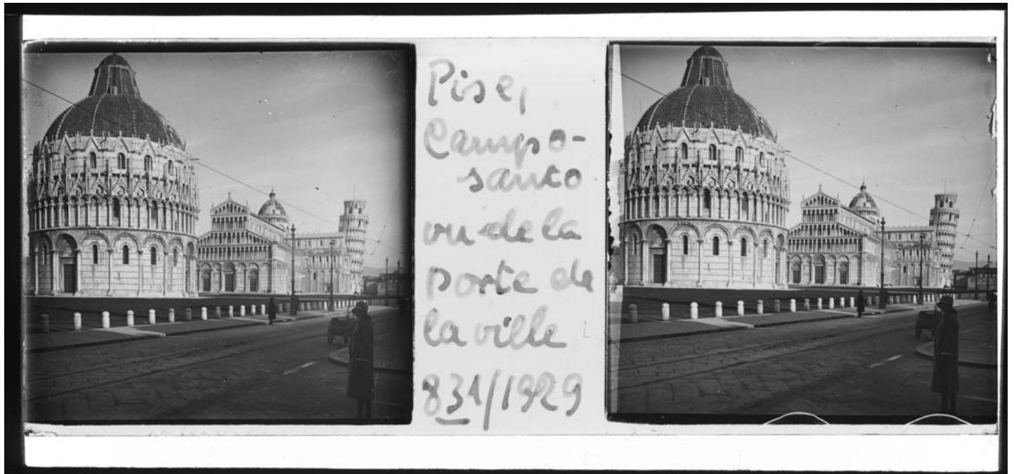
Pisa, Camposanto mit Dom und Baptisterium, 1929.

im Dunkeln der Seminarräume statt. Seitdem Ordinarius Ferdinand Vetter im Wintersemester 1903/04 eine Vorlesung mit Lichtbildern über die kirchliche Baukunst des Mittelalters ankündigte, fanden diverse Medien ihre Anwendung. Beginnend bei Gipsabgüssen, Originalen und grafischen Vorlagewerken über die Entdeckung von Epidiaskopien und Dia-Projektion, über den Einsatz von Fotografie und Film bis hin zu interaktiven Hypermedia-Anwendungen im Internet und als CD-ROM führt der lange Weg. Heutzutage sind die digitalen Sammlungen und Bilddatenbanken auf dem Vormarsch, und so verwaist die Diathek – einst visuelles Gedächtnis, Schatztruhe anregender Zufälligkeiten und Mahnmal der eigenen Lückenhaftigkeit – zusehends. Mit dem Auf- und Ausbau Digitaler Sammlungen rücken die althergebrachten Wunschvorstellungen der Spätphase des Historismus nach allumfassender Kategorisierung und permanentem Zugriff auf enzyklopädische Wissensspeicher in greifbare Nähe.