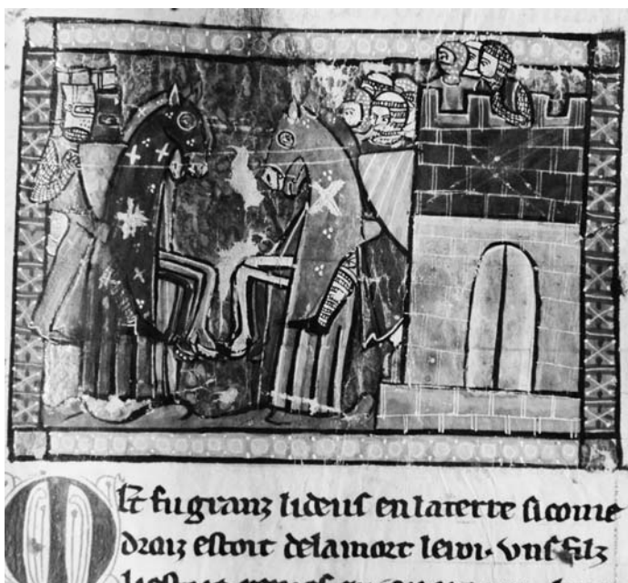
Der Goldhintergrund der Miniatur aus Deckfarbenmalerei blättert ab. Lose Schollen werden vor dem Ausstellen der Handschrift gefestigt. BBB, Cod. 112, fol. 181r, Wilhelm von Tyrus, Geschichte des Heiligen Landes, 14. Jh.

Im 15. Jahrhundert werden in Norditalien die leichten Buchdeckel aus Karton erfunden. Kostbare Bücher werden nach arabischem Vorbild über und über mit Gold verziert. Neben den gedruckten Büchern lagern in den Magazinen Archivalien wie Pergamenturkunden oder Korrespondenz in allen möglichen Druck- und Kopiertechniken. Gross- und kleinformatige Karten gehören wie Skizzen, Zeichnungen und Druckgrafik zu den Einblattformen. Aus dem 19. Jahrhundert sind Fotografien in den verschiedensten Positiv- und Negativformen in Familienarchiven und anderen Sammlungen erhalten. Im 20. Jahrhundert erweitert sich die Materialpalette