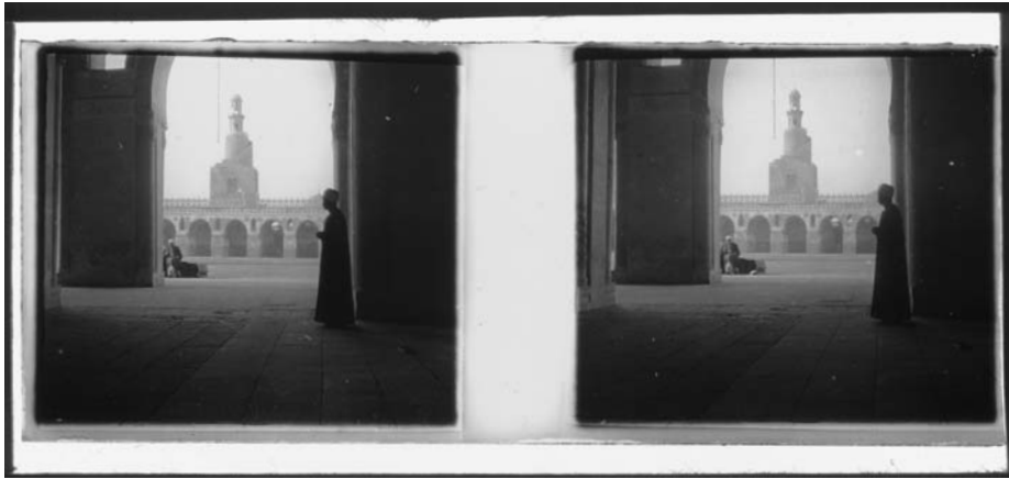
Kairo, Ibn Tulun-Moschee, Blick durch Arkadenbogen auf Minarett, Anfang zwanziger Jahre.