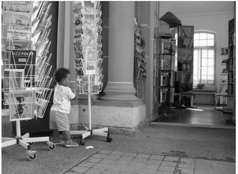
Lese- und Spielpavillon der Kornhausbibliotheken Bern auf der Münsterplattform.

Es wäre in jedem Fall benutzerfreundlich. Ich erachte unterschiedliche Kataloge für die Recherche in Bern als eine Zumutung für unsere Kundinnen und Kunden. Längerfristig ist es wünschenswert, Bestände zusammenzuführen und in einem gemeinsamen Katalog auszuweisen.